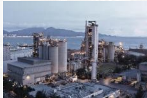
Clinker & Cement Production