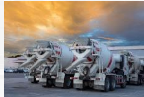
Logistics & Delivery