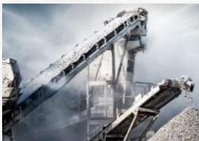
Raw Material Extraction